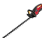
HHH 36 BXB