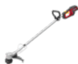
HHT 36 BXB