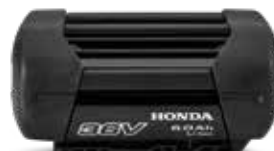
36V 6,0 Ah DP3660XA