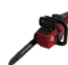
HHC 36 BXB