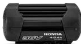
36V 4,0 Ah DP3640XA