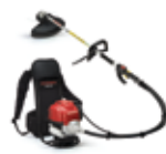
UMR 435 T