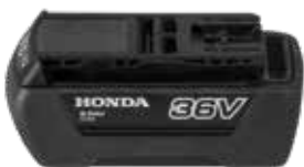
36V 2,0 Ah DP3620XA E

Een selectie universele Li-ion-accu's van Honda voor het accu assortiment.